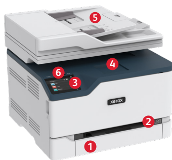
Stampante multifunzione a colori Xerox® C235