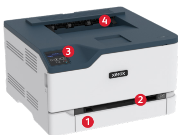
Stampante a colori Xerox® C230