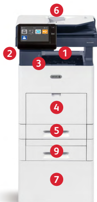
Stampante multifunzione Xerox® VersaLink® B615 Stampa. Copia. Scansione. Fax. E-mail.