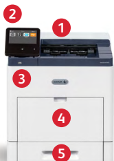
Stampante Xerox® VersaLink® B610 Stampa.